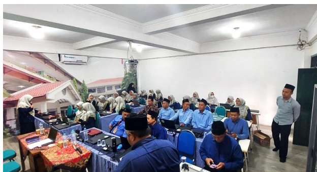
Gambar 2. Sesi diskusi dan tanya jawab

Materi kedua yang disampaikan mengenai strategi memilih jurnal dan melakukan pengiriman naskah artikel ( submit ) secara online ke OJS. Materi ini dipilih sebab berdasarkan hasil studi pendahuluan ditemukan fakta bahwa sebagian besar guru masih belum bisa mencari atau mengakses jurnal ilmiah terakreditasi dan melakukan submit naskah ke OJS. Dalam sesi kedua ini juga diberikan tips dan trik menghindari jurnal predator, yakni dengan cara melakukan pemeriksaan melalui laman SINTA Kemdikbud untuk jurnal nasional dan Scopus.com untuk jurnal internasional bereputasi. Pada sesi ini, peserta dipersilakan untuk mempraktikkan cara mencari jurnal sesuai dengan background ilmu di laman SINTA menggunakan laptop masing-masing.