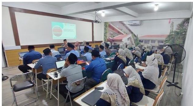
Gambar 1. Penyampaian materi oleh narasumber

Materi kedua yang disampaikan mengenai strategi memilih jurnal dan melakukan pengiriman naskah artikel ( submit ) secara online ke OJS. Materi ini dipilih sebab berdasarkan hasil studi pendahuluan ditemukan fakta bahwa sebagian besar guru masih belum bisa mencari atau mengakses jurnal ilmiah terakreditasi dan melakukan submit naskah ke OJS. Dalam sesi kedua ini juga diberikan tips dan trik menghindari jurnal predator, yakni dengan cara melakukan pemeriksaan melalui laman SINTA Kemdikbud untuk jurnal nasional dan Scopus.com untuk jurnal internasional bereputasi. Pada sesi ini, peserta dipersilakan untuk mempraktikkan cara mencari jurnal sesuai dengan background ilmu di laman SINTA menggunakan laptop masing-masing.