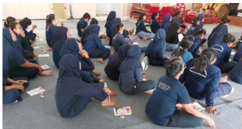
Gambar 3. Peserta Memperhatikan Pemaparan Materi

ini sangat penting dalam menyediakan akses informasi yang tepat dan relevan bagi narapidana perempuan, membantu mereka untuk mengambil keputusan yang lebih baik terkait kesehatan mereka sendiri dan mencegah terjadinya stunting sejak 1.000 hari pertama kehidupan.