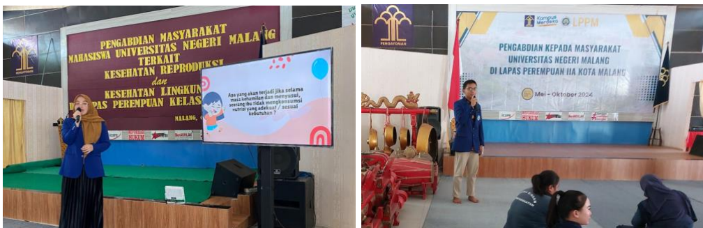
Gambar 1. Pemaparan Materi oleh Narasumber

pada ibu hamil. Edukasi dan konseling gizi yang tepat, terutama selama 1.000 hari pertama kehidupan menjadi fokus dalam sesi ini untuk meningkatkan pengetahuan dan keterampilan para peserta.