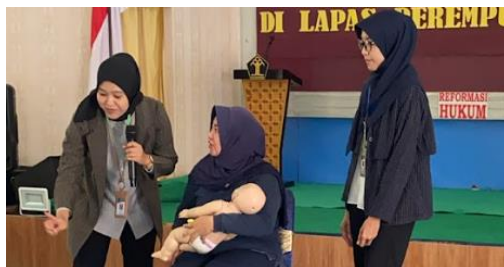
Gambar 2. Praktik Teknik Menyusui

Sesi kedua dilaksanakan pada tanggal 28 Mei 2024. Dalam sesi ini, materi yang disampaikan lebih mendalam, dengan penekanan pada kesehatan ibu hamil dan persiapan persalinan di dalam Lapas. Para narapidana diajari mengenai pentingnya pemeriksaan kesehatan secara rutin selama masa kehamilan dan perawatan kesehatan yang dapat dilakukan di lingkungan lembaga. Materi ini juga mencakup dukungan psikologis yang diperlukan selama kehamilan, fasilitas medis yang tersedia untuk proses persalinan, tindakan darurat yang perlu diambil dalam situasi kritis, serta pentingnya menyusui dan teknik menyusui (Gambar 2).