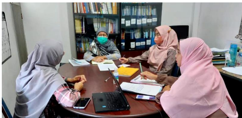
Gambar 3. FGD Kedua dengan Pengelola Prodi