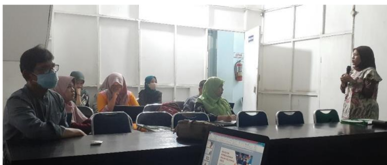
Gambar 5. Pemaparan Materi mengenai Small Group Discussion

Pelatihan hari kedua pelatihan dilakukan pada tanggal 29 Juli 2022 bertempat di APIKES IRIS Padang. Kegiatan diawali dengan pemaparan materi oleh salah seorang tim pengabdian masyarakat yakni tentang memfasilitasi kelas kecil/ kelompok mahasiswa (Gambar 5). Materi ini mengajak peserta merefleksikan bagaimana peserta selama ini melakukan diskusi pada mahasiswa di kelompok kecil. Materi ini juga memandu peserta dalam menjadi fasilitator pada kelompok tersebut.