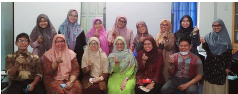
Gambar 2. FGD Pertama bersama Pengelola Prodi dan Staf Pengajar