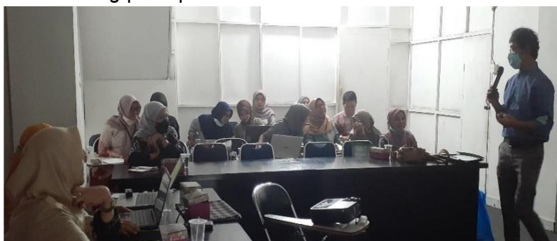
Gambar 4. Pemaparan Materi mengenai Metode Kuliah Interaktif

bertahan selama perkuliahan lebih dari 30 menit. Materi yang disampaikan dosen senior dari DPK mengingatkan peserta tentang kegiatan interaktif dengan mahasiswa yang perlu selalu dijaga, baik melalui diskusi langsung ataupun memanfaatkan aplikasi online seperti kuis dan lain sebagainya. Kedua materi di atas membuka wawasan bagi para dosen dan menginspirasi mereka untuk melakukan kegiatan perkuliahan lebih interaktif dan melakukan pendekatan dengan mahasiswa sehingga materi yang diberikan dapat dipahami dengan mudah oleh mahasiswa. Pada akhir pertemuan, peserta mengungkapkan keinginannya untuk memperbaiki pola mengajar yang selama ini mereka terapkan, dan mereka akan mempraktekannya pada kegiatan praktik microteaching pada pelatihan hari kedua.