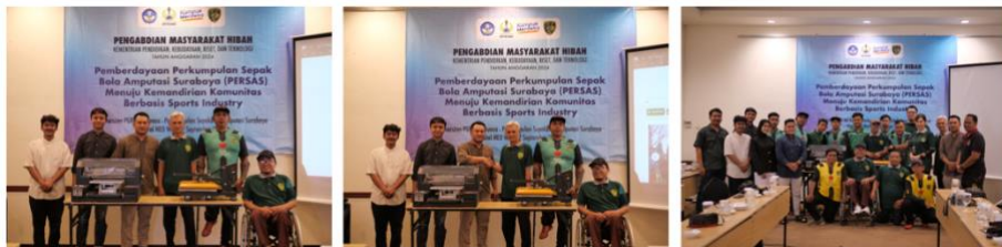
Gambar 5. Penyerahan DTG