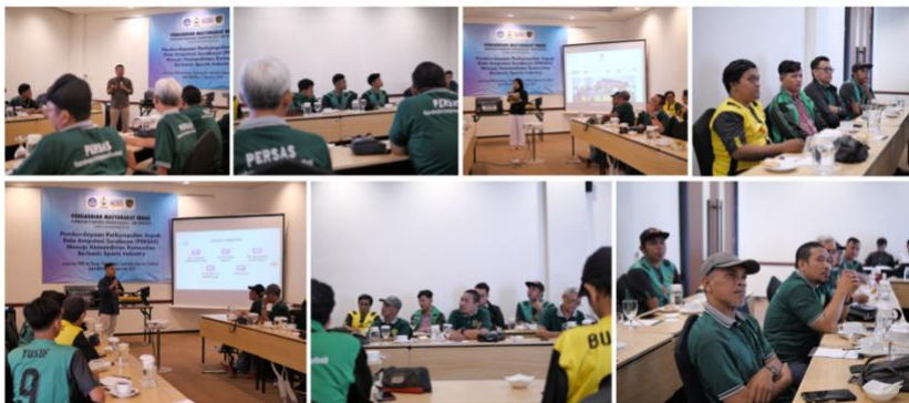
Gambar 4. Pelaksanaan Pelatihan

Pelatihan yang dilaksanakan pada tanggal 7 September 2024 di Hotel NEO+ Sidoarjo ini mengangkat materi tentang pendanaan klub, peningkatan pendapatan, pemasaran dan branding serta pengelolaan keuangan. Peserta yang produktif memiliki peranan yang penting keberhasilan pelatihan. Harapannya pada usia produktif peserta betul betul dapat menjadi nilai tambah sehingga dapat menerapkan pengetahuan baru yang didapatkan dari proses pelatihan tersebut. Peserta antusias dalam mengikuti pelatihan yang dapat dilihat dari interaksi pada saat pelatihan.