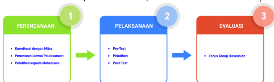
Gambar 2. Metode Pelaksanaan

Metode pelaksanaan pengabdian kepada masyarakat pemberdayaan perkumpulan sepak bola amputasi surabaya (PERSAS) menuju kemandirian komunitas berbasis sports industry dijabarkan menggunakan langkah perencanaan, pelaksanaan dan evaluasi. Metode pada Gambar 2 dipilih karena menyasar ada akar penyebab masalah pada PERSAS. Peserta dalam pengabdian masyarakat ini berjumlah 25 yang terdiri dari pengurus dan pemain PERSAS. Pelaksanaan pelatihan bertempat di Hotel Neo+ Waru Sidoarjo.