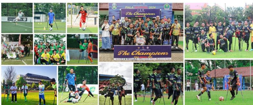
Gambar 1. Perkumpulan Sepak Bola Amputasi Surabaya

memberdayakan komunitas penyandang disabilitas pada Gambar 1 . Dengan pendekatan yang berbasis industri olahraga, PERSAS tidak hanya berorientasi pada pencapaian prestasi di lapangan, tetapi juga berusaha menciptakan kemandirian ekonomi bagi para anggotanya. Organisasi ini didirikan dengan tujuan memberikan wadah bagi individu penyandang amputasi untuk berolahraga dan berkompetisi ( Clemente et al., 2024 ). Selain meningkatkan kesehatan dan kebugaran, kegiatan ini bertujuan untuk membangun rasa percaya diri dan mengurangi stigma negatif terhadap penyandang disabilitas ( Muracki et al., 2023 ). Dalam konteks ini, pemberdayaan komunitas menjadi kunci utama untuk menciptakan lingkungan yang inklusif.