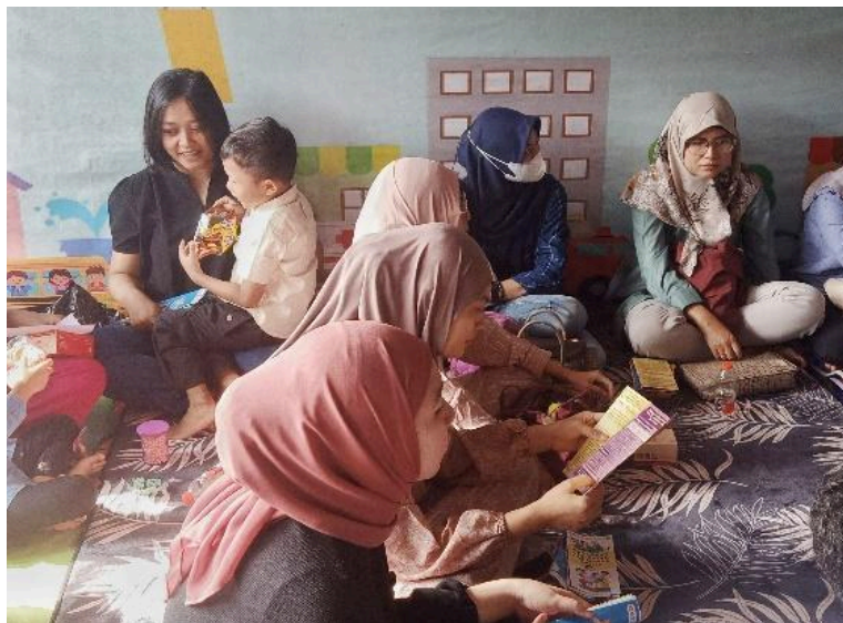
Gambar 4. Penggunaan media leaflet sebagai media pelengkap

Media promosi sangat bergantung pada daya tarik, karena tujuannya adalah menarik perhatian, membangkitkan minat, dan mempengaruhi masyarakat. Pada konteks kesehatan, promosi yang efektif harus mampu membuat individu atau komunitas terkait ingin membaca, memperhatikan, dan memperoleh wawasan baru dari informasi yang disajikan. Penggunaan media seperti leaflet dan poster memungkinkan penyebaran pesan kesehatan ke khalayak luas, menjadikannya sarana yang efektif untuk menjangkau banyak orang melalui pesan penting yang ingin disampaikan (Barik et al., 2019).