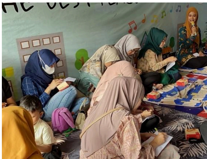
Gambar 2. Peserta mengerjakan soal pre-test sebelum kegiatan inti seminar

Penyampaian materi Seminar disampaikan oleh Tim Dosen dari Prodi Kebidanan Fakultas Kedokteran Universitas Negeri Malang menggunakan slide Canva ( Gambar 3 ). Kegiatan inti dari seminar ini terbagi menjadi dua sesi. Sesi awal yaitu pemberian materi dengan sub-materi: konsep tumbuh kembang anak, pemenuhan kesehatan anak, dan pemenuhan gizi pada anak serta sesi kedua dengan sub materi pengasuhan responsif, keamanan dan keselamatan pada anak, dan stimulasi pertumbuhan dan perkembangan anak. Setiap selesai satu sesi diikuti dengan kegiatan diskusi atau tanya jawab. Peserta tampak antusias selama kegiatan Seminar berlangsung dinilai melalui keaktifan peserta pada saat sesi diskusi baik pada sesi pertama dan sesi kedua.