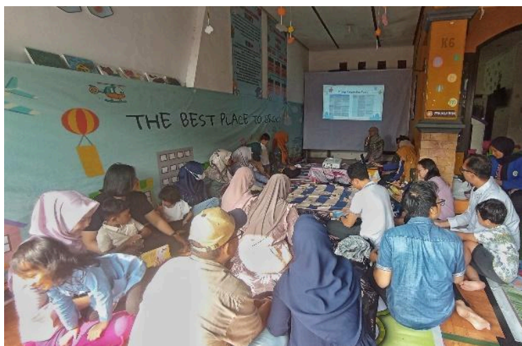
Gambar 3. Pemaparan materi Seminar Parenting oleh narasumber

Penyampaian materi Seminar disampaikan oleh Tim Dosen dari Prodi Kebidanan Fakultas Kedokteran Universitas Negeri Malang menggunakan slide Canva ( Gambar 3 ). Kegiatan inti dari seminar ini terbagi menjadi dua sesi. Sesi awal yaitu pemberian materi dengan sub-materi: konsep tumbuh kembang anak, pemenuhan kesehatan anak, dan pemenuhan gizi pada anak serta sesi kedua dengan sub materi pengasuhan responsif, keamanan dan keselamatan pada anak, dan stimulasi pertumbuhan dan perkembangan anak. Setiap selesai satu sesi diikuti dengan kegiatan diskusi atau tanya jawab. Peserta tampak antusias selama kegiatan Seminar berlangsung dinilai melalui keaktifan peserta pada saat sesi diskusi baik pada sesi pertama dan sesi kedua.