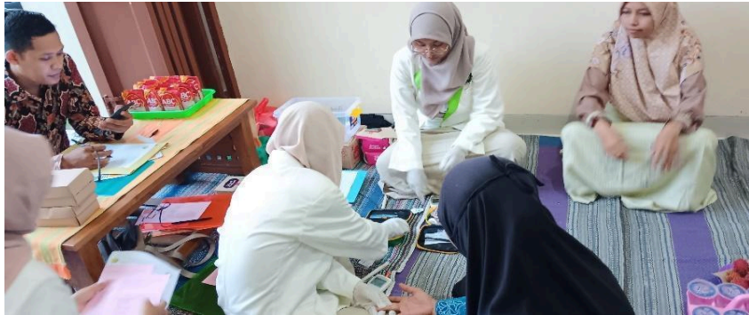
Gambar 3. Pemeriksaan Kesehatan oleh Tim Pengabdian kepada Masyarakat