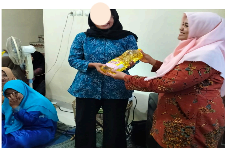
Gambar 7. Pemberian Doorprize kepada Mitra Pengabdian Masyarakat