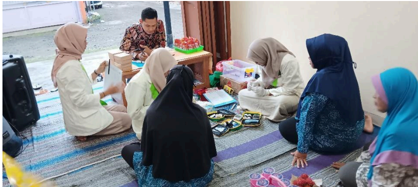
Gambar 4. Mitra Kegiatan Pengabdian kepada Masyarakat Antusias Mengikuti Pemeriksaan Kesehatan

Selanjutnya, kegiatan PKK dilaksanakan sebagaimana mestinya, dan penyampaian materi mengenai kewaspadaan keracunan pangan masuk ke dalam bagian pengisian materi yang bertepatan dengan jadwal penugasan pengisian materi dari Kelompok kerja III PKK (Pokja III PKK). Seperti yang kita ketahui, Pokja III PKK membidangi program pangan, sandang, perumahan, dan tata laksana rumah tangga, sehingga materi yang disampaikan oleh tim pengabdian masyarakat Prodi K3, Fakultas Ilmu Kesehatan Universitas Bhamada Slawi sangat relevan dengan bidang Pokja III PKK.