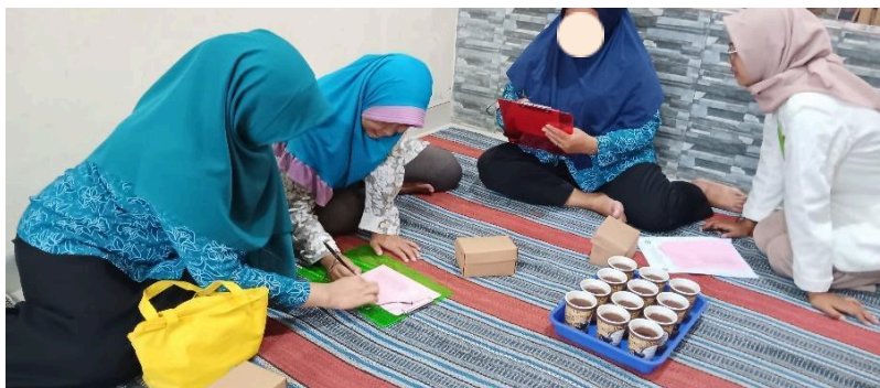
Gambar 2. Pengisian Kuesioner Pre-test Kegiatan Pengabdian Masyarakat