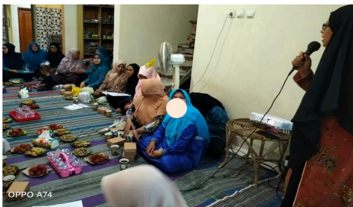
Gambar 6. Mitra Kegiatan Pengabdian kepada Masyarakat Antusias Menyimak Materi Kewaspadaan Keracunan Pangan