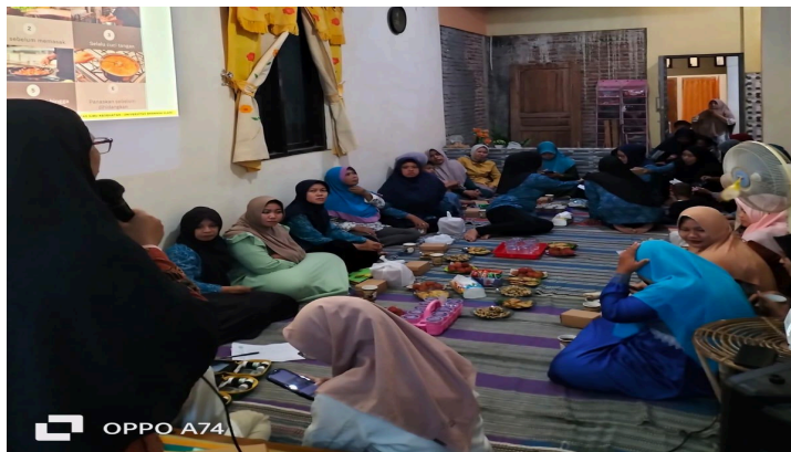
Gambar 5. Tim Pengabdian Masyarakat memberikan Penyuluhan Kewaspadaan Keracunan Pangan