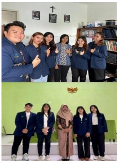
Gambar 1. Proyek untuk Pengajuan Kemitraan

hidup/kinerja, dan kemampuan mengelola diri sendiri/keterampilan intrapersonal. Keterampilan lunak mencakup berbagai aspek seperti komunikasi, manajemen waktu, pemikiran kritis, kreativitas, dan kepemimpinan, (Dahlia, 2022).