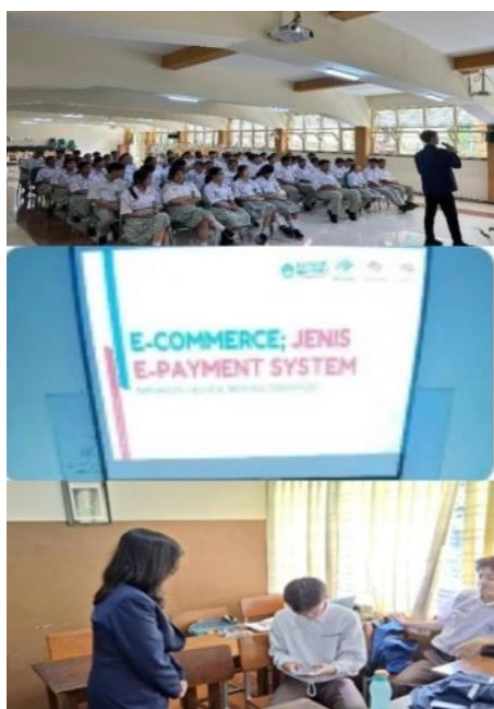
Gambar 3. Implementasi Proyek