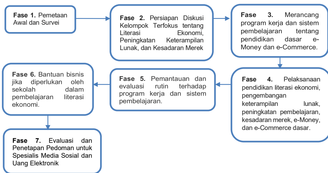
Gambar 2. Metode Kegiatan Pengabdian