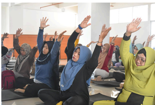
Gambar 2. Yoga Bersama

Selain yoga, pijat relaksasi telah terbukti mendukung peningkatan kesehatan fisik; beberapa penelitian menunjukkan bahwa pijat dapat mengurangi ketegangan otot dan memperbaiki sirkulasi darah secara signifikan (Delano et al., 2022). Efek pijat juga dilaporkan memberi ketenangan emosional dan signifikan dalam menurunkan tingkat kecemasan (Kurniastuti et al., 2025). Temuan lapangan yang menunjukkan bahwa peserta merasa segar dan rileks setelah menerima pijat relaksasi selaras dengan teori tersebut. Hal ini memperkuat pemahaman bahwa pijat relaksasi merupakan bentuk intervensi sederhana namun berdampak besar bagi kesehatan caregiver.