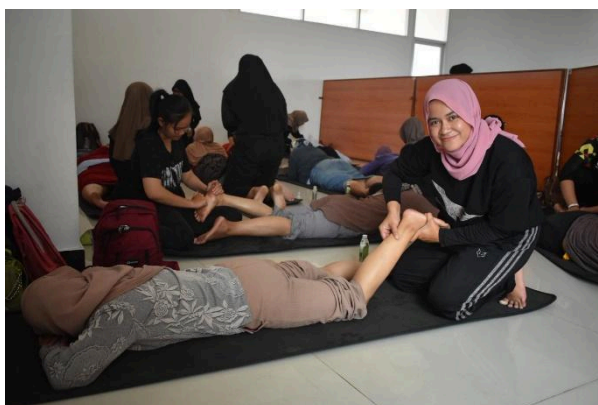
Gambar 3. Pijat Relaksasi

memberikan gambaran awal mengenai kondisi kesehatan peserta, tetapi juga meningkatkan kesadaran untuk melakukan pemeriksaan rutin. Hal ini sejalan dengan temuan bahwa skrining risiko Penyakit Tidak Menular (PTM) melalui pemeriksaan laboratorium sederhana dan pengukuran tekanan darah sangat penting untuk mendeteksi faktor risiko PMT sejak dini dalam masyarakat (Tamalsir et al., 2025). Selain itu, pemeriksaan sederhana seperti pengukuran tekanan darah dan kadar gula darah terbukti efektif meningkatkan kesadaran masyarakat terhadap kondisi kesehatan otomodifikasi dan pentingnya deteksi dini (Chasanah et al., 2023). Respon positif peserta terhadap kegiatan skrining mengindikasikan bahwa layanan sederhana ini dapat mendorong perubahan perilaku menuju gaya hidup sehat.