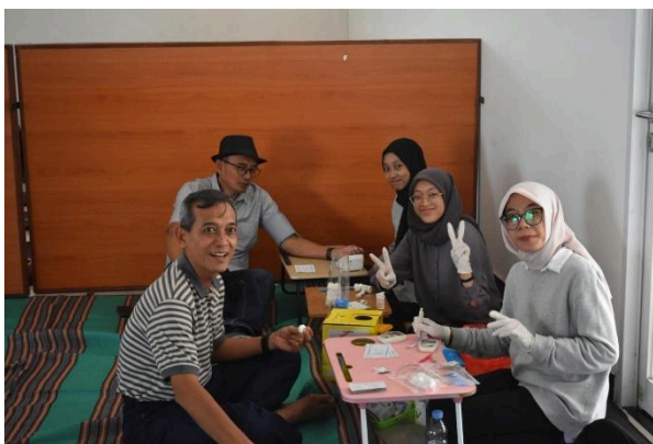
Gambar 1. Skrining Kesehatan

dipahami sebagai strategi relaksasi yang berkontribusi nyata terhadap kesejahteraan peserta.