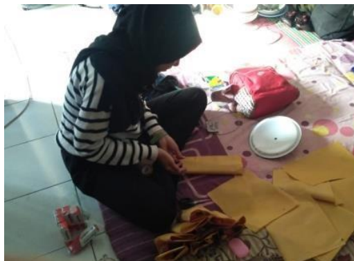
Gambar 2. Proses Pembungkusan Kado

Pada tahap persiapan proker yang pertama adalah persiapan materi PHBS, yaitu : 7 langkah cara mencuci tangan dengan menggunakan lagu anak-anak dan cara menggosok gigi dengan media video cara menggosok gigi dengan benar. tahap selanjutnya adalah membuat ember kran untuk anak-anak mencuci tangan. pembuatan ember kran cuci tangan dilakukan secara manual dengan melubangi bagian bawah ember dan dipasangkan kran. Ember kran cuci tangan dibuat untuk praktik cara mencuci tangan serta dapat digunakan sehari-hari oleh anak-anak untuk mencuci tangan sebelum kegiatan mengaji dimulai.