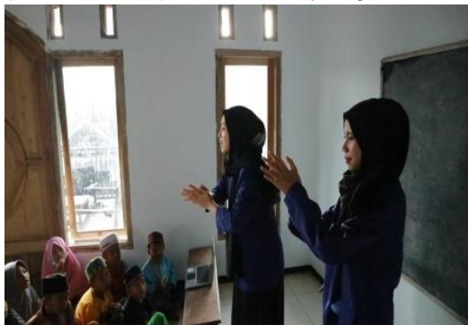
Gambar 3. Pelatihan 7 Langkah Cuci Tangan

Tahapan ketiga merupakan implementasi program kerja dalam bentuk pelatihan 7 cara mencuci tangan dengan benar dan cara menggosok gigi. Kegiatan pelatihan dilakukan secara langsung di TPQ Riyadlul Qur'an II dengan durasi waktu serta pembatasan jumlah anak yang hadir dalam pelatihan.