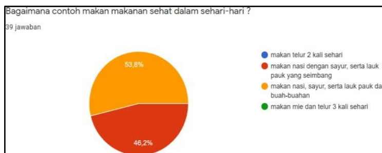
Gambar 6. Diagram pemahaman murid tentang contoh makan-makanan sehat

Berdasarkan hasil responden adalah 53,8% menjawab dengan benar contoh makan makanan dalam sehari-hari. Hasilnya 21 anak-anak menjawab dengan benar dan 18 anak menjawab kurang tepat. Maka dapat disimpulkan bahwa anak-anak masih membutuhkan bimbingan tentang makan makanan sehat dalam sehari-hari Cara menggosok gigi dengan benar perlu diajarkan dimasa anak-anak karena untuk memperoleh pengetahuan dasar untuk kebersihan penyesuaian diri dari masa anak-anak ke dewasa dan