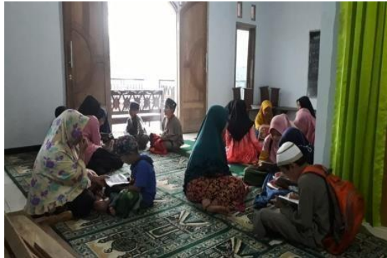
Gambar 1. Observasi