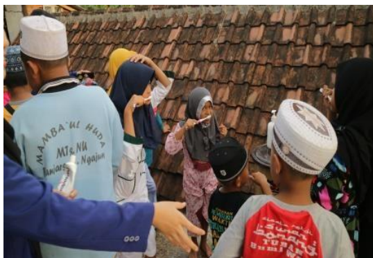
Gambar 3. Pelatihan 7 Langkah Cuci Tangan

Selanjutnya penyerahan hadiah bagi murid TPQ Riyadlul Qur'an II sebelum pulang ke rumah masing-masing