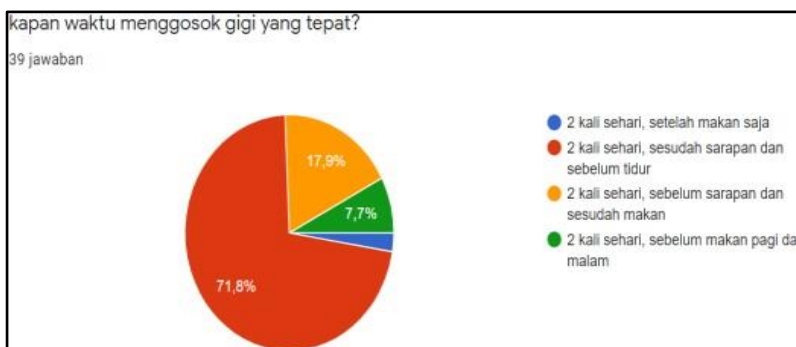
Gambar 8. Diagram pemahaman murid tentang dampak pentingnya menggosok gigi

Berdasarkan hasil responden bahwa 64,1 % murid TPQ Riyadlul Qur'an II tahu akan pentingnya menggosok gigi dan dampak apabila tidak menggosok gigi. Berdasarkan hasil tersebut lebih dari 50% murid di TPQ mengetahui dampak jika tidak menggosok gigi. 25 anak menjawab gigi berlubang jika tidak menggosok gigi, dan 14 anak menjawab gigi menjadi kotor. Dari hasil tersebut menunjukkan bahwa stigma dari sebagian anak-anak jika tidak gosok gigi hanya akan mengalami gigi kotor, padahal dampak dari tidak menggosok gigi adalah permasalahan kesehatan gusi, gigi dan mulut. Selanjutnya adalah aturan menggosok gigi dengan benar murid di TPQ Riyadlul Qur'an II.