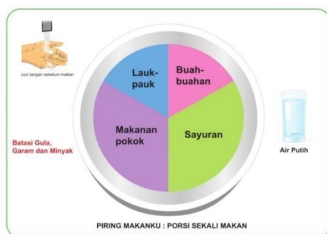
Gambar 5. Porsi Makan sehari-hari

observasi anak-anak cenderung lebih suka makan makanan instan seperti mie instan dan tidak dibatasi jumlah konsumsi perharinya. Oleh karena itu perlu adanya edukasi porsi makan makanan sehat untuk anak-anak. Makanan makanan sehat penting untuk pertumbuhan dan perkembangan anak. Apabila anak tidak tercukupi gizinya salah satu dampaknya adalah anak stunting (pendek), anak yang pendek akan berkembang menjadi remaja yang pendek dan memiliki kemampuan fisik dan otot yang kurang yang tidak semestinya seperti remaja lainnya (Harsian et al., 2016). Adliyani (2015) mengatakan bahwa agar dapat menjadi lebih baik dan sejahtera, perilaku hidup sehat sangatlah mempengaruhi, oleh karena itu maka sama-sama kita menjaga gizi pada makanan kita.