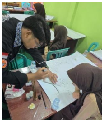
Gambar 2. Pengarahan pada santriwati

Pada sesi kedua, fokus pelatihan beralih pada pengembangan keterampilan lanjutan dan pembuatan karya kaligrafi yang lebih kompleks. Hasil dari sesi ini sangat menggembirakan, di mana santriwati mampu menciptakan karya kaligrafi yang menunjukkan kreativitas dan keterampilan yang telah berkembang. Beberapa santriwati bahkan mulai menuliskan gaya kaligrafi mereka sesuai dengan contoh yang telah diberikan oleh instruktur, menggabungkan elemen tradisional dengan sentuhan pribadi. Oleh karena itu,