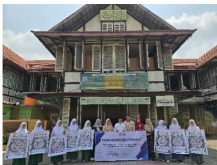
Gambar 5. Hasil akhir karya santriwati

Dukungan dari guru dan pihak sekolah juga memainkan peran penting dalam keberhasilan program ini, dengan menyediakan fasilitas dan bahan yang diperlukan untuk pelatihan. Selain itu, keterlibatan orang tua yang mendukung anak-anak mereka dalam mengembangkan keterampilan ini turut mendorong keberhasilan pelatihan. Selain untuk mengekspresikan keindahan kalam Allah, proses pembuatan karya seni kaligrafi ini sangat membantu manusia untuk membentuk karakter Islam yang sebenarnya. Dengan detail-detail kaligrafi yang harus diperhatikan, khat yang beragam dengan kesulitan yang berbeda, dan kaidah penulisan atau tata bahasa yang harus diperhatikan agar tidak terjadi salah pengertian memaksa pelukis untuk senantiasa sabar, tekun, gigih, dan disiplin. Tak hanya itu, karakter-karakter lain juga akan terbentuk dengan seiring waktu mempelajari kaligrafi (Lestari, Ichsan, Sukriyanto, & Asela, 2021).