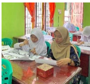
Gambar 3. Pengaplikasian handam pada karton

Pembahasan sesi ini menekankan pentingnya dukungan berkelanjutan dan pengayaan materi pelatihan untuk menjaga minat dan perkembangan keterampilan siswa. Partisipasi aktif orang tua dan komunitas sekolah dalam menghargai dan mendukung karya santriwati juga sangat berpengaruh terhadap keberhasilan program. Secara keseluruhan, sesi kedua berhasil mencapai tujuan untuk mengembangkan keterampilan kaligrafi santriwati dan melibatkan mereka dalam pelestarian seni kaligrafi.