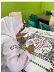
Gambar 4. Proses penulisan Ayat

Hasil dari program ini menunjukkan peningkatan minat dan keterampilan siswa dalam seni kaligrafi, yang terlihat dari karya santriwati yang semakin berkualitas dan kreatif. Santriwati yang sebelumnya tidak mengenal kaligrafi, kini mampu menghasilkan karya yang indah dan bernilai seni tinggi. Program ini juga berhasil menanamkan rasa bangga terhadap seni tradisional Islam, yang tercermin dari antusiasme siswa dalam mengikuti pelatihan dan pameran kaligrafi.