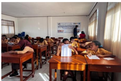
Gambar 2. Pengisian Kuesioner Pretest

Kegiatan tanya jawab pada PkM ini tidak hanya sebatas pada penentuan peserta yang akan dilatih, namun juga dilakukan terhadap beberapa variabel berupa: karakteristik peserta, perilaku bullying serta pengetahuan dan sikap terhadap bullying yang ditanyakan pada saat sebelum ( pre-test ) dan sesudah ( post-test ) kegiatan penyuluhan dilakukan, khusus untuk pertanyaan perilaku bullying hanya ditanyakan pada saat pretest saja, hal ini dilakukan karena team PkM ingin mengidentifikasi apakah peserta menjadi pelaku bullying di sekolah.