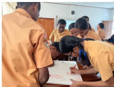
Gambar 7. Game interaktif pada saat proses pembelajaran

Media interaktif dapat dirancang untuk mempromosikan sikap anti- bullying melalui cerita, video interaktif dan game yang mendorong empati dan kerjasama (Revelta Domínguez et al., 2023). Sikap anti- bullying yang dipromosikan melalui program intervensi dapat mengurangi kejadian bullying sebesar 35% dalam lingkungan sekolah (Perret et al., 2020), hal ini juga terlihat pada hasil penelitian Kim et al (2022) menjelaskan, jika penggunaan game interaktif dalam kurikulum sekolah mengurangi kejadian bullying sebesar 20%. Program ini tidak terbatas dari penyebaran informasi yang dilakukan oleh PIK-R melalui media interaktif saja serta memastikan PIK-R disekolah sebagai agen untuk mencegah terjadinya bullying disekolah dengan mempromosikan pencegahan bullying , tidak hanya sampai itu saja, keberlanjutan dari program ini akan memastikan pihak sekolah untuk membentuk Tim Pencegahan dan Penanganan Kekerasan (TPPK) di sekolah untuk mencegah dan memanggulangi kejadian bullying dan kekerasan di sekolah.