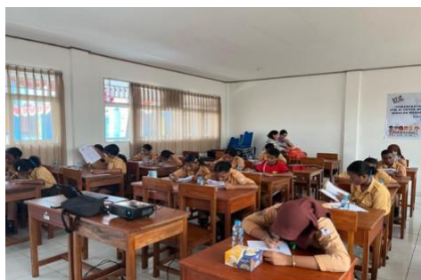
Gambar 3. Pengisian Kuesioner Post-test

Karakteristik peserta pada kegiatan PkM terlihat jika proporsi siswa-I yang berusia 14 tahun lebih banyak dibandingkan dengan siswa-I yang berusia 13 tahun dan 15 tahun sekitar 52.4%, dengan jenis kelamin terbanyak adalah perempuan (71.4%) serta suku terbanyak adalah suku Papua dengan proporsi sekitar 76.2% yang dapat terlihat pada Tabel 1.