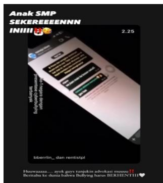
Gambar 6. Video Interaktif Peserta yang di upload dalam Sosial Media