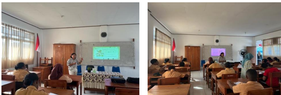
Gambar 5. Pemaparan materi tentang Bullying

memanfaatkan PIK-R untuk mencegah dan menyebarkan-luaskan terkait konsep bullying kepada sesama teman ( peer ). Kegiatan penyuluhan yang dilakukan dapat terlihat pada Gambar 5 .